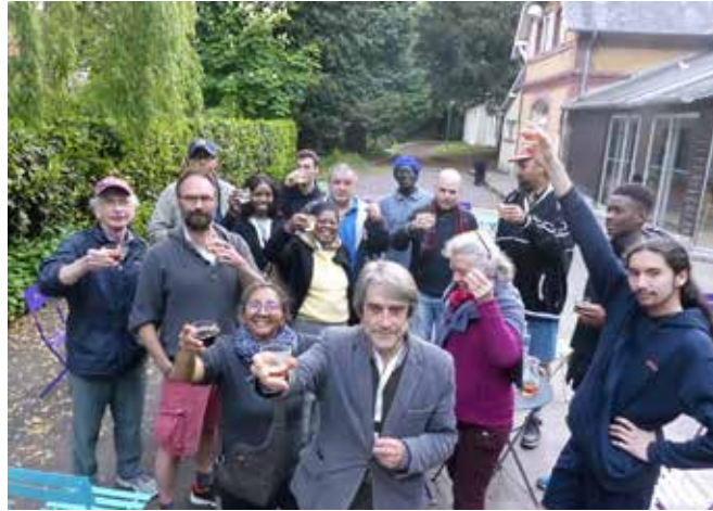
Houlgate - retour après 15 jours A Cœur du Cinq, avec UBI, le 29/05/2019 et les participants au séjour à Houlgate

A 100%. J'y retourne. Je le referai. Je ne changerai rien. Est-ce que je peux y retourner ? Je cours à Saint Lazare.