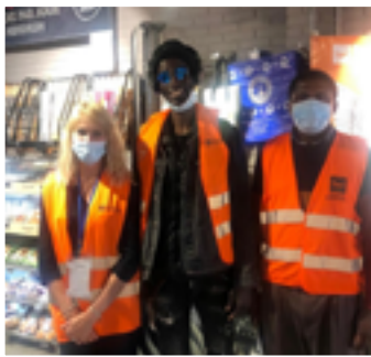
Collecte de la Banque alimentaire

Lors de la collecte Banque alimentaire en mai, grâce à la générosité des clients du Carrefour Lacépède, l'excellente mobilisation des bénévoles et des accueillis, nous avons récolté plus de 600 kg de produits pour notre fonctionnement. Encore merci aux participants !