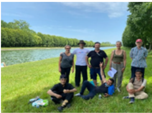
Journée au Château de Fontainebleau avec UBI !