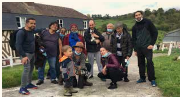
▲ Cœur du Cinq au grand air de Houlgate

Mais c'est une raison de plus pour porter la lumière de l'Espérance, qui nous oriente et nous guide sur les chemins de la vie, comme annoncé dans l'Évangile. C'est sur notre expérience de la Fraternité que nous nous efforçons de vivre à Cœur du Cinq, que nous pouvons rebondir avec foi et force renouvelées par nos rencontres toutes simples, nos accompagnements avec nos amis de la rue.