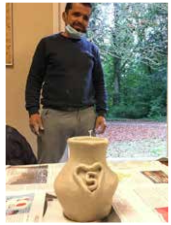
Nouveauté à Houlgate, l'atelier de poterie ▶

CŒUR DU CINQ ET UN BALLON POUR L'INSERTION (UBI)