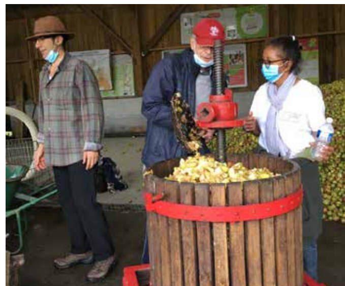
▲ Arrivée du jus de pomme nouveau