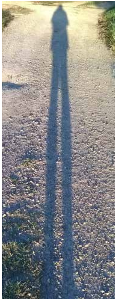
En Chemin grandir