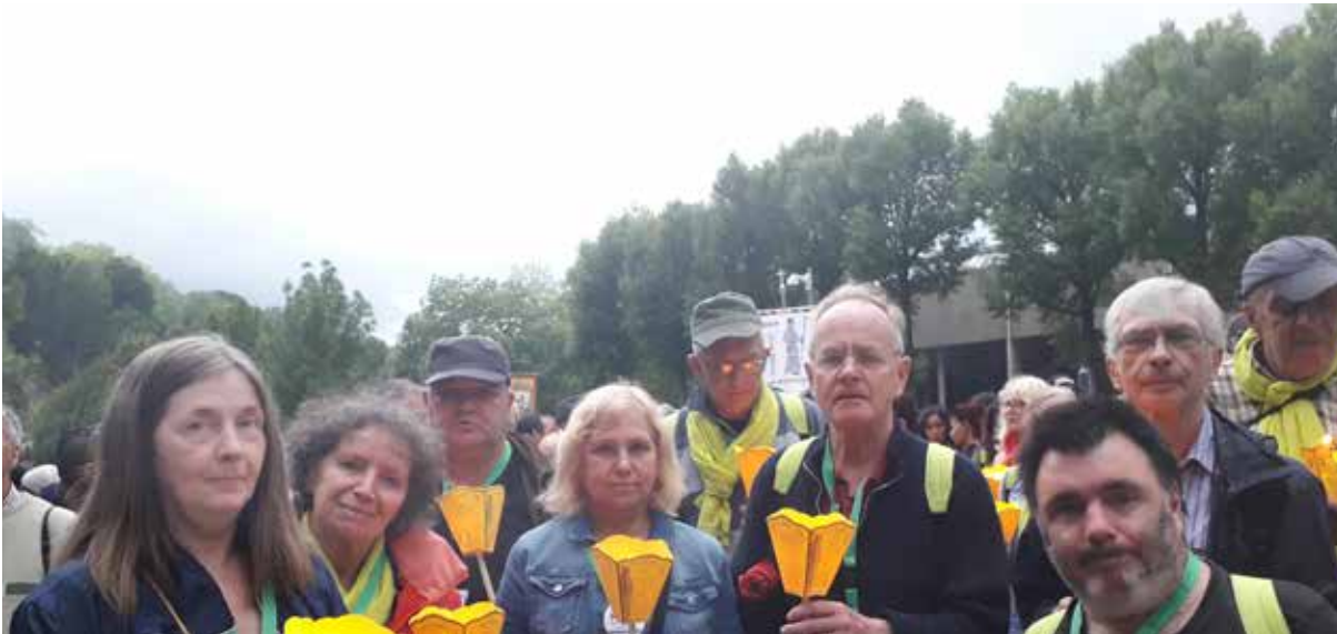
◀ Cœur du Cinq en lumière à Lourdes

Proposé par le Vicariat pour la Solidarité du Diocèse de Paris, ce pèlerinage s'adresse aux personnes subissant la solitude, la précarité ou l'exclusion pour vivre trois journées de partage, de convivialité et d'approfondissement : « Faites tout ce qu'Il vous dira » (Jean 2,5).