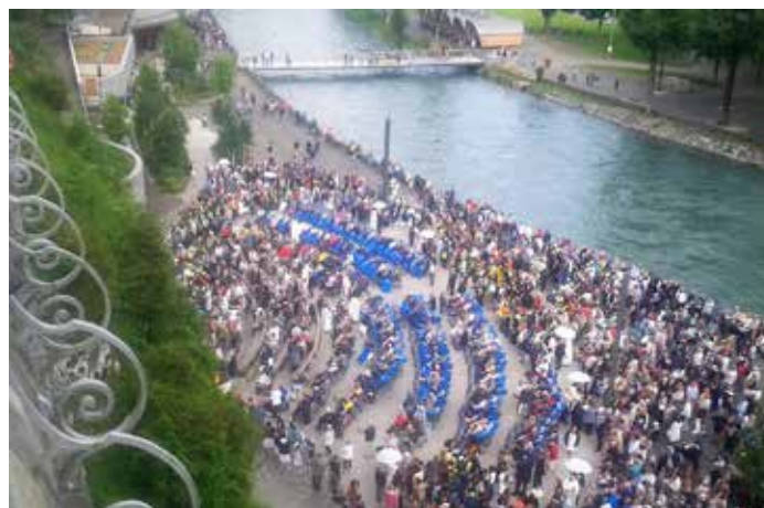
▲ Ferveur autour de la grotte