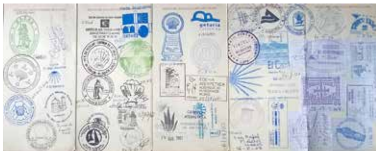
▲ Crédencial du pèlerin

Partir et regarder ses cicatrices laissées par la vie, retrouver la sérénité : le paysage guérit les souffrances passées, referme les plaies.